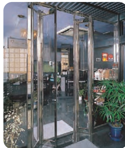
ミニフォールド (ステンレス鏡面仕上げ)