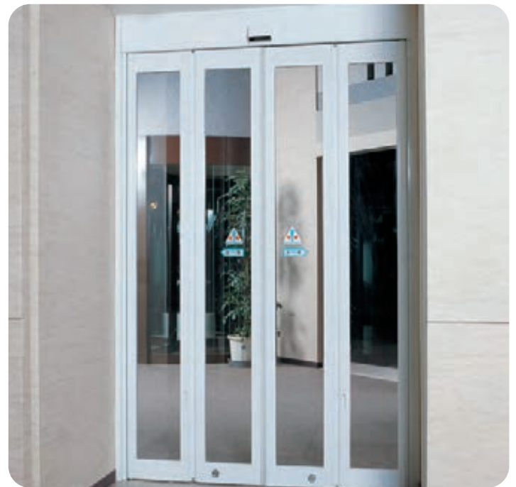
ミニフォールド(アルミ)