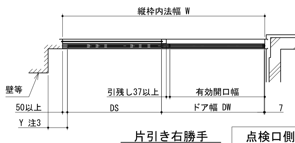
片引き右勝手 点検口側