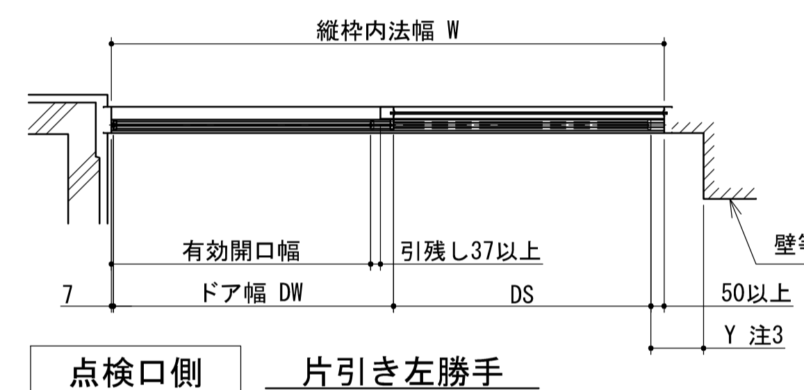
点検口側 片引き左勝手