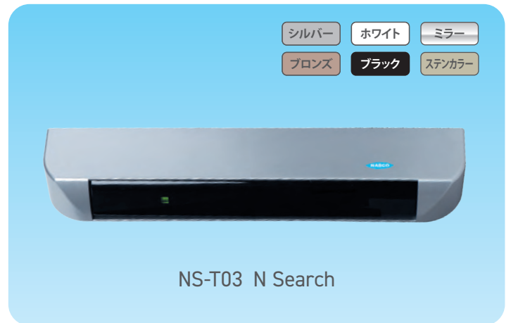
NS-T03 N Search