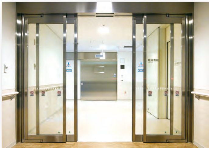
▲人が通行する時は、引き戸で必要十分な開口

業界初！引き戸とフルオープンを手軽に切り替え。 快適な通行を実現する2WAYドア